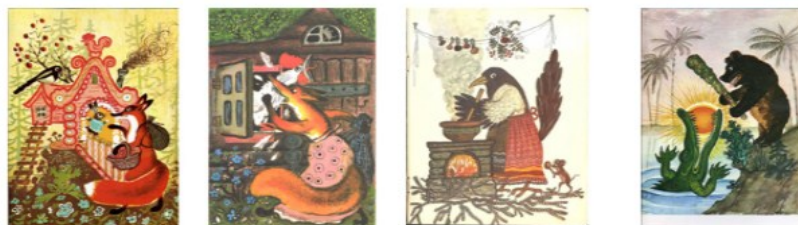
Рисунок 1. Иллюстрации Ю.А. Васнецова

животные перенимают качества людей, их образ жизни и даже человеческие наряды. Звери в иллюстрациях Васнецова очень добрые, забавные и немножко смешные. Их хочется оберегать и защищать. Детям интересно смотреть, как одевает Васнецов своих героев. Нарядно и празднично – кормилицу маму-Козу, маму-Сороку. Наденет им обязательно цветные юбки в оборках да кружевах. А обиженного Лисой Зайку пожалеет, тёплую кофту наденет. Волков, медведей, лис, которые добрым зверям жить мешают, художник старался не наряжать: не заслужили они красивой одежды. Так художник учит детей отличать добро и зло. Некоторые иллюстрации Ю.А. Васнецова представлены на рисунке 1.