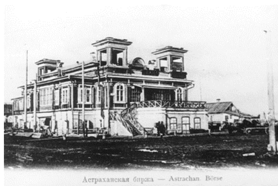
Рисунок 3. Вид биржи. Начало XX в.

Литератор и журналист Василий Немирович-Данченко удивленно отмечал: «Тут пытит пароход, точно целый город на воде, там какая-то каша из рыбниц, лодок, маленьких шхун. Вот грузные морские пароходы привалили и замерли у пристаней, а там за ними лодки морские... Ухо улавливает смутный шелест бесчисленных флагов, говор разноязычной толпы...».