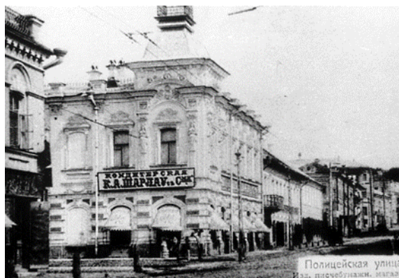
Рисунок 4. Вид «Шарлау». Начало XX в.

все виды шоколада, изысканные пирожные, торты, глазированные фрукты, конфеты, печенья, кексы.