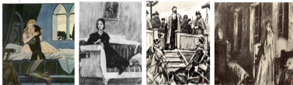
Рисунок 2. Иллюстрации Д.А. Шмаринова

Иллюстрированная книга наделена особыми функциями. Входя вместе с другими художественно оформленными в систему предметно эстетического окружения, сопутствуя человеку от младенчества до старости, книга наделяет