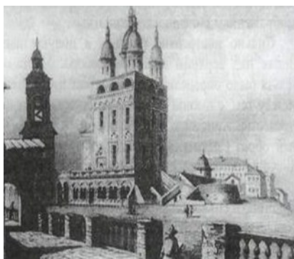
Рисунок 1. Вид Кремля XVIII в.

Он формировался на протяжении четырёх веков и насчитывает 22 здания-памятника – военные, административные и церковные здания [3].