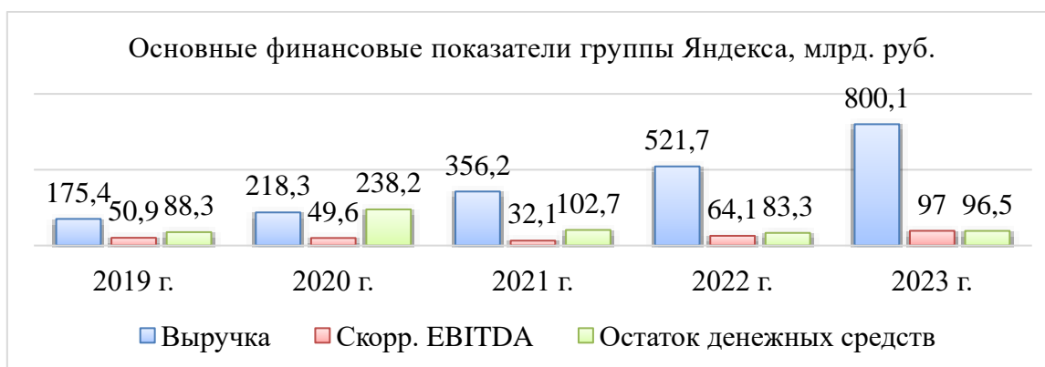
Рисунок 1. Основные финансовые показатели группы Яндекса

За последние несколько лет доходы группы Яндекса непрерывно увеличивались, отражая стабильное положение компании на рынке. В частности, рост выручки сопровождался значительным повышением чистой прибыли, благодаря чему компания имеет достаточно финансов для инвестиций в новые проекты и расширение текущих направлений бизнеса. Основные финансовые показатели группы Яндекса представлены на рисунке 1.