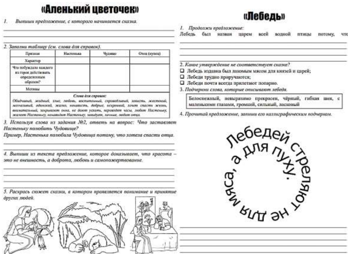
Рисунок 1. Страницы из читательского дневника

Затем, прочитав одну книгу дети выполняли задания. Задания носили продуктивный характер, то есть необходимо было найти общие черты характера, мотивов, нарисовать словесный портрет героя, проанализировать отрывки из произведения с социально-значимыми действиями, разыграть сценку и многое другое (см. рисунок 1).