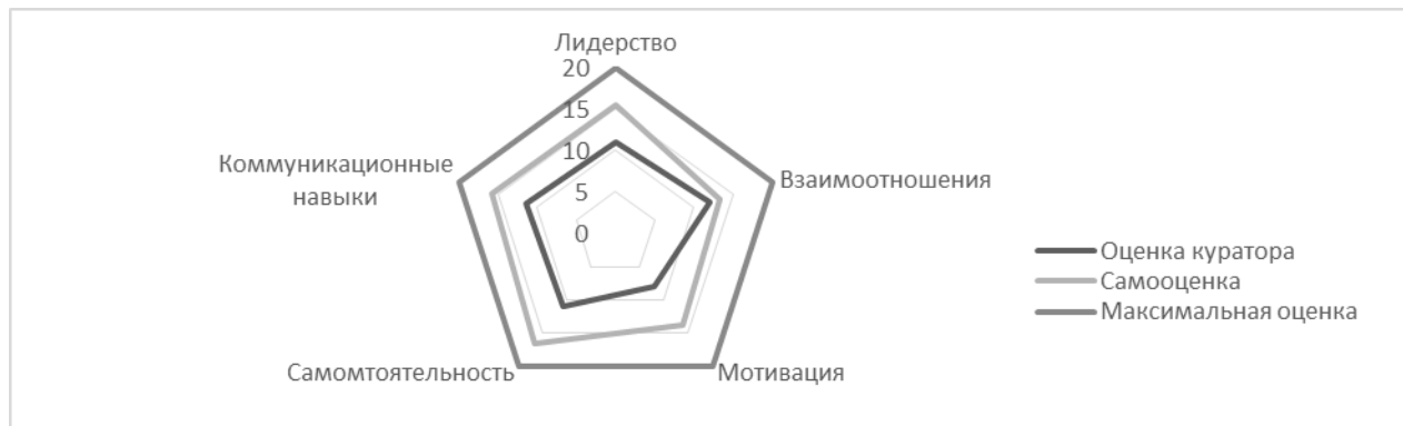
Рисунок 1. Результаты самооценки и оценки куратора

Был рассчитан пример по студенту – активисту (рисунок 1)