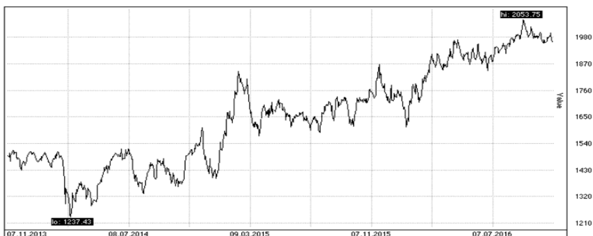
Рисунок 1. Динамика индекса ММВБ в 2014–2016гг.

Рассмотрим динамику фондового рынка РФ в 2014–2016гг.[4].