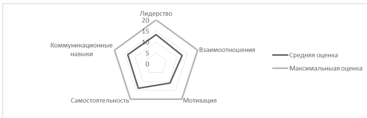
Рисунок 2. Результаты средней оценки студента-активиста

На рисунке 2 представлены результаты средней оценки студента-активиста.