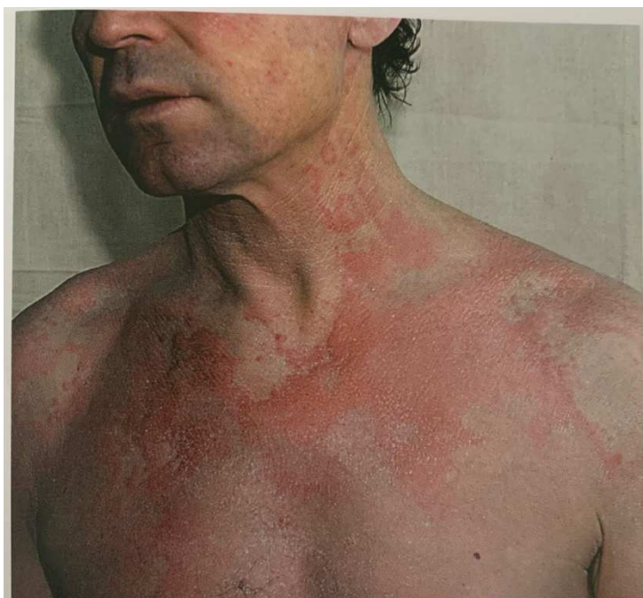
Рис. 7. Лекарственная токсикодермия по типу крапивницы (на кожных покровах уртикарные элементы)