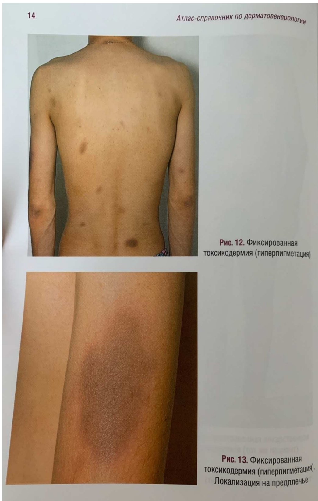
Рисунок 1. Пример

Распространенная токсидермия – тяжелое заболевание, при котором кожно-слизистая симптоматика сочетается с поражением других органов и систем (повышение температуры тела, ознобы, диспепсические явления, адинамия, коматозное состояние и др.).