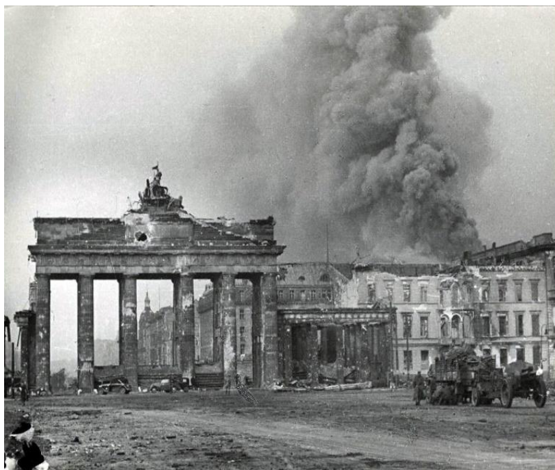
Рисунок 12. Бранденбургские ворота во времена Второй мировой войны

Полная реставрация Квадриги была выполнена в 1958 году, благодаря сохранившемуся чертежам и слепкам. Однако главному украшению Бранденбургских ворот вновь понадобились руки умелых реставраторов. Работы были завершены в 1991 году.