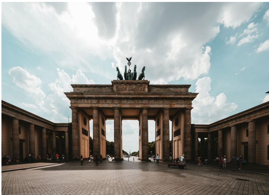
Рисунок 11. Бранденбургские ворота в настоящее время

Бранденбургские ворота (нем. Brandenburger Tor) – единственные, сохранившиеся из 18-ти, городские ворота и истинная ценность Берлина, благодаря не только их красоте, но и вкладу в историю города и всей Германии. На рисунке 11 изображены Бранденбургские ворота в настоящее время.