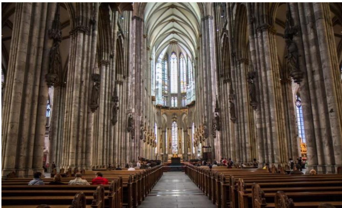
Рисунок 6. Кёльнский собор изнутри

Вдоль стен у алтаря – коллекция скульптур библейских святых. В соборе 14 статуй Иисуса Христа, статуи Девы Марии и двенадцати апостолов. Центр зала венчает роскошный мраморный алтарь. Главной ценностью храма является золотая гробница, в которой покоятся останки волхвов. Также там находится и Миланская Мадонна, и двухметровый дубовый крест Геро. На рисунке 6 изображён Кёльнский собор изнутри. На рисунке 7 изображены реликвии собора.