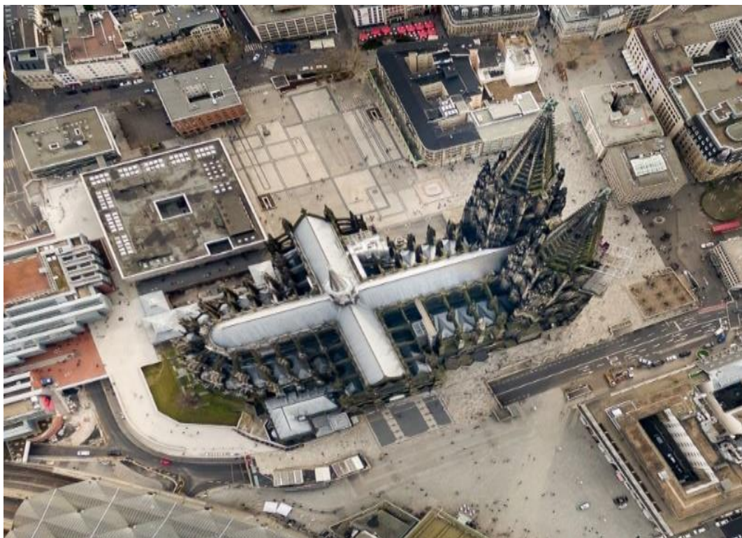
Рисунок 5. Вид сверху на Кёльнский собор

Если посмотреть на Кёльнский собор сверху, то можно заметить, что план собора выполнен в виде латинского креста и имеет два прохода с обеих сторон, которые поддерживают высокий готический свод. На рисунке 5 изображён Кёльнский собор с видом сверху.