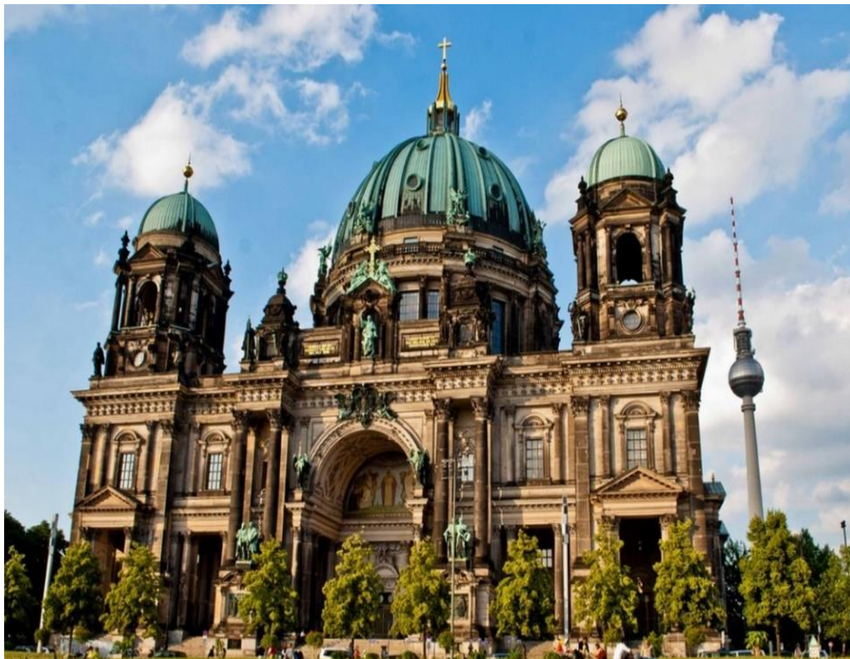
Рисунок 1. Берлинский кафедральный собор в настоящее время

Берлинский кафедральный собор (нем. Berliner Dom) – это самая большая протестантская церковь Германии. Входит в Евангелическую церковь Германии – объединение(я) лютеранских и реформатских земельных Церквей Германии. Располагается на Музейном острове Берлина. На рисунке 1 изображён Берлинский кафедральный собор.