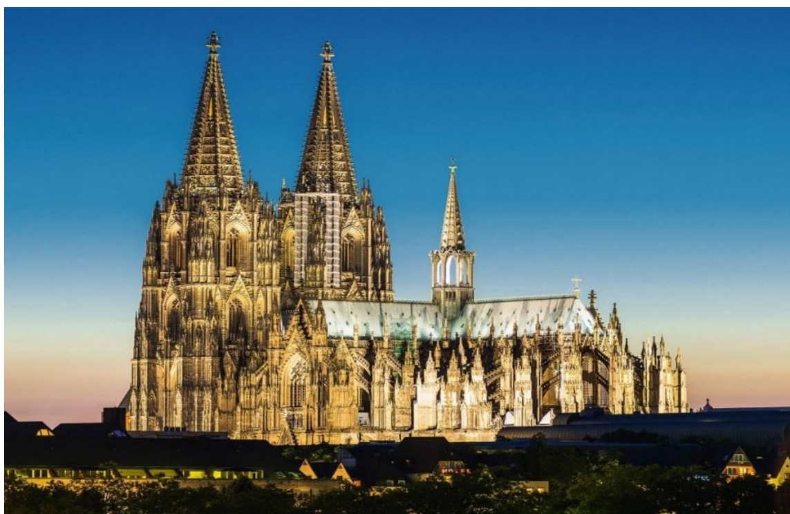
Рисунок 4. Кёльнский собор в настоящее время

Кёльнский собор (нем. Kölner Dom) – это римско-католический готический собор в немецком городе Кёльне. Занимает третье место в списке самых высоких церквей мира и внесён в список объектов Всемирного культурного наследия. Туристов привлекает грандиозная архитектура и особая атмосфера внутри, но и его история. На рисунке 4 изображён Кёльнский собор.