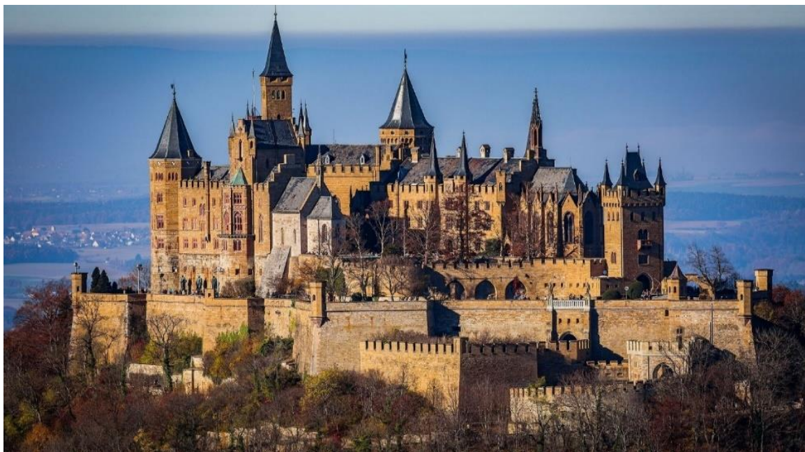
Рисунок 8. Замок Гогенцоллерн в настоящее время

Замок Гогенцоллерн (нем. Burg Hohenzollern) – старинный замок-крепость в Баден-Вюртемберге, находится в 50 километрах южнее Штутгарта, на горе Гогенцоллерн в Швабском Альпе, на высоте 855 метров. Достопримечательность была фамильной вотчиной могущественной династии Гогенцоллернов. На рисунке 8 изображён замок Гогенцоллерн.