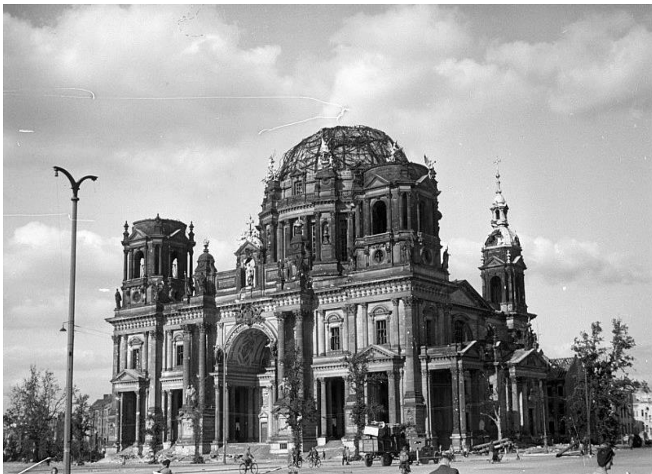
Рисунок 2. Берлинский кафедральный собор во время Второй мировой войны

Смотря на достопримечательность снаружи, можно заметить, что основной портал в виде арки обрамляют мощные гранитные колонны, между которыми бронзовые статуи евангелистов: Марка, Иоанна, Луки и Матфея. По краям арки – склонённые фигуры ангелов. Над воротами – живописная фреска с изображением Христа.