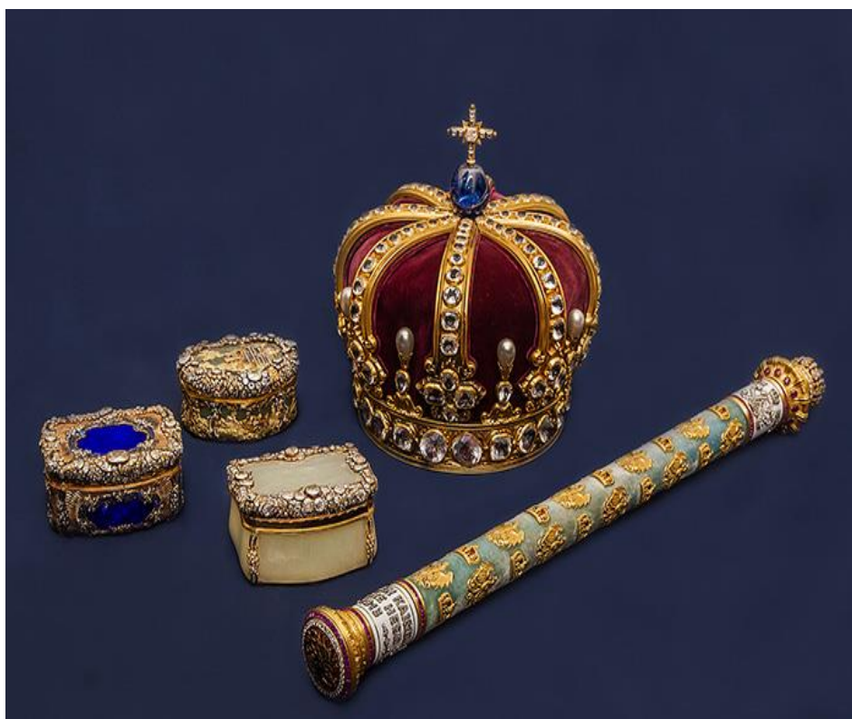
Рисунок 10. Реликвии замка Гогенцоллерн

На сегодняшний день, в замке Гогенцоллерн действует открытый театр, проходят концерты и кинопоказы в летний период. В ясные ночи есть возможность поучаствовать в наблюдении за звездным небом. А со смотровой площадки можно полюбоваться долинами и зелеными холмами.