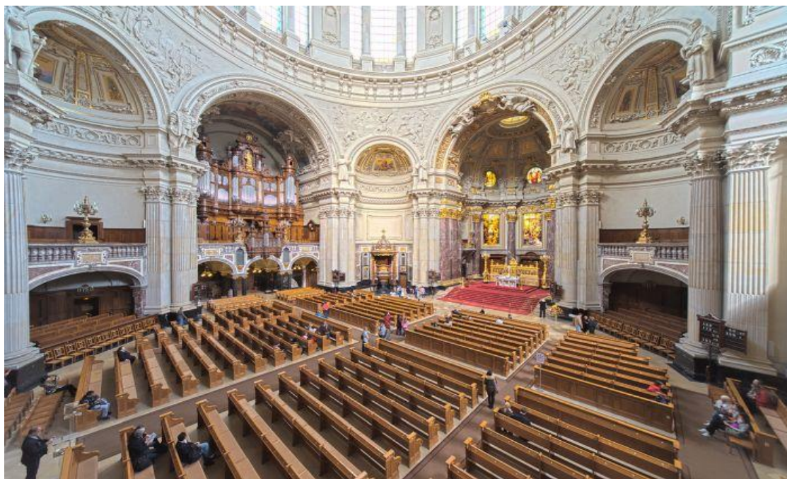
Рисунок 3. Берлинский кафедральный собор изнутри

В настоящее время храм содержится за счёт собственных средств. Собор находится под охраной ЮНЕСКО.