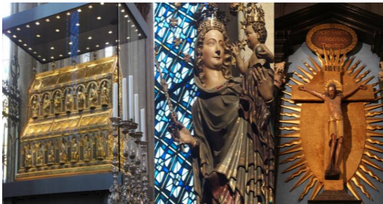
Рисунок 7. Реликвии собора