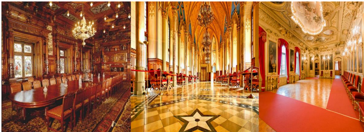
Рисунок 9. Интерьер замка Гогенцоллерн

Главной гордостью рода Гогенцоллерн являются – императорская корона, рыцарские и королевские доспехи, а также пострадавшая от пули военная амуниция Фридриха Великого. На рисунке 9 изображён интерьер замка Гогенцоллерн. На рисунке 10 изображены реликвии замка Гогенцоллерн.