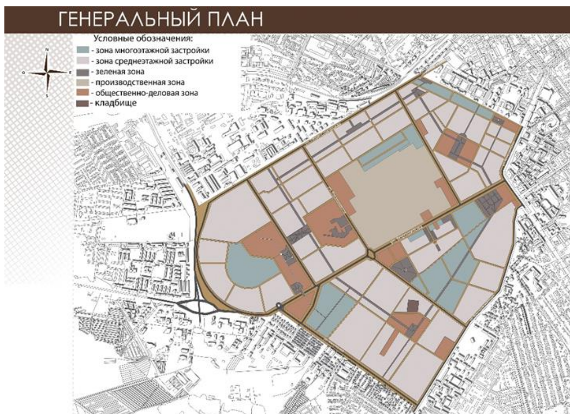
Рисунок 1. Генеральный план

В сложившейся инфраструктуре города необходим свежий взгляд на развитие и формирование улицы. Для преобразования территории нужно сделать следующее: