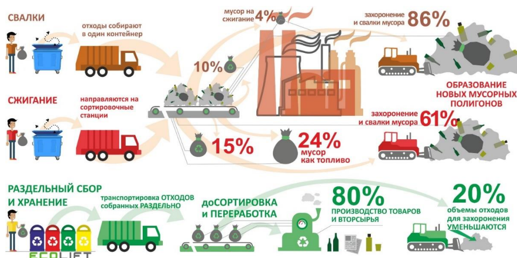
Рисунок 1. Этапы утилизации мусора

Основная проблема в утилизации мусора в России – это отсутствие сортировки мусора и разработки технологических процессов. Экономическая целесообразность способа переработки отходов зависит от стоимости альтернативных методов их утилизации, положения на рынке вторсырья и затрат на их переработку. Также существует определенная трудность в том, чтобы вписать мусороперерабатывающий завод в промышленную инфраструктуру отдельного региона, отследить все логистические связи и потребности региона во вторичных ресурсах. На мой взгляд гораздо предпочтительнее рассматривать процесс мусоропереработки как завершённый цикл производства ликвидной продукции, например, выделение макулатуры из ТБО.