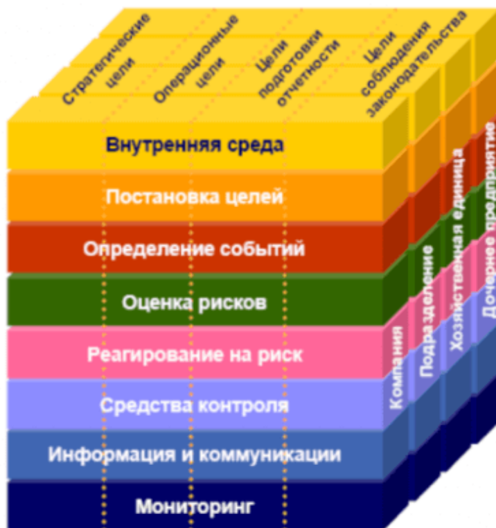
Рисунок 1. Элементы системы внутреннего контроля (по COSO)

Фундаментом системы внутреннего контроля является контрольная среда, которая формирует организационную культуру, в которой контроль воспринимается как естественная часть управленческих процессов [6]. Контрольная среда включает этику и ценности организации, политику руководства по внутреннему контролю, структуру управления и распределение полномочий, а также политику подбора и оценки персонала. Эффективная контрольная среда способствует повышению ответственности сотрудников и формирует основу для всех остальных элементов контроля.