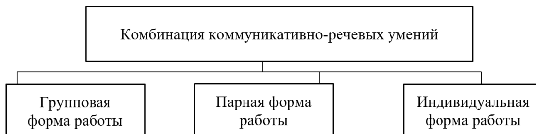
Рисунок 1. Формы коммуникативно-речевых умений

Рассматривая позицию Н.В. Аникина, можно отметить, что автор рассматривает понятие коммуникативно-речевых умений через их структуру организации и уточняет, что они могут быть комбинированными и включать следующие формы, представленной на рисунке 1 [1, с. 22].