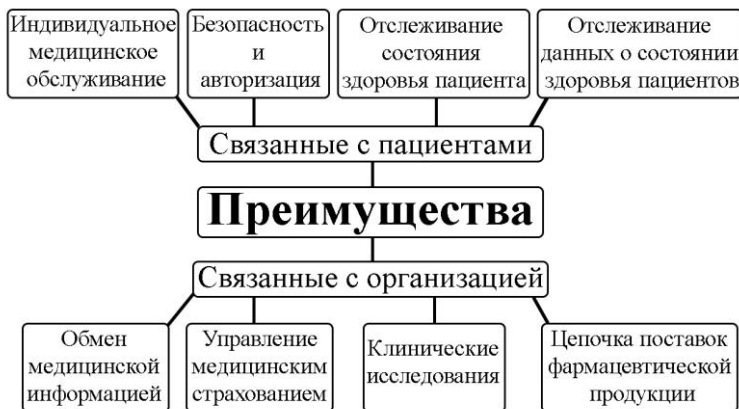
Рисунок 1. Преимущества технологии блокчейн в медицине

Блок в блокчейн-сети содержит четыре элемента: информацию, хэш (идентификационный номер) текущего блока, хэш предыдущего блока и временную метку, где каждый новый блок связан с предыдущим блоком [2].