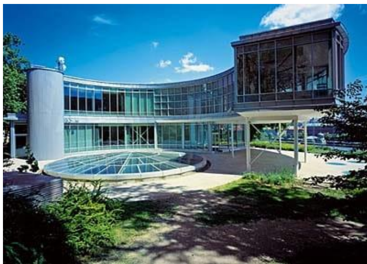
Рисунок 2. Вид на чехословацкий павильон в Праге, Летенские сады

Увидеть павильон и провести время на празднике жизни частично можно и сегодня и лишь в восстановленном виде. После всемирной выставки чехословацкий павильон перевезли в Прагу, в Летенские сады, где он долгое время был открыт для посетителей в качестве ресторана. В 1991 году павильон сгорел, с тех пор восстановили только небольшую его часть (Рис. 2) [2].